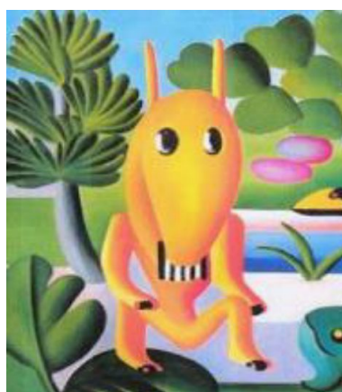
Antropofagia (1929) Tarsila do Amaral

A Semana de Arte Moderna de 1922 e o Movimento Modernista: O ano de 1922 foi palco de uma série de eventos que iriam marcar para sempre o panorama das artes no Brasil. Vários artistas plásticos participaram da mostra realizada no Teatro Municipal de São Paulo, entre eles: Anita Malfatti e Di Cavalcanti. Alguns artistas que na época estavam fora do Brasil mandaram trabalhos para representá-los, como é o caso de Vicente do Rêgo Monteiro e Victor Brecheret. O evento incluiu artes plásticas, arquitetura, música e literatura. O principal objetivo dos artistas envolvidos na Semana de 22 era apresentar um novo caminho para a produção artística nacional, produzindo uma arte verdadeiramente brasileira que rompesse com os modelos importados da Paris acadêmica, ao mesmo tempo, associada ao ritmo de desenvolvimento das cidades modernas.